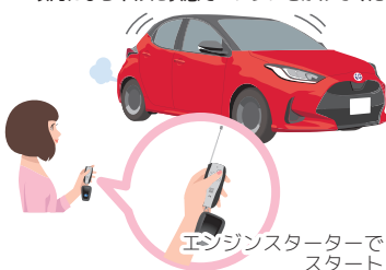
エンジンスターターで スタート

エンジンスターターのリモコンと車の電子キーを3cm 以内にぶら下げた状態でエンジンをかけてください。