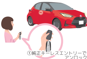
①純正キーレスエントリーで アンロック

・お車から降りたときに、 車両のスマートエントリーまたは純正キーレスエントリーでドアロックをしていませんか？ その際は① 純正キーレスエントリーが居る場所 から、純正キーレスエントリーでアンロックを行ってください。 その後で② エンジンスターターでドアロック を行ってください。