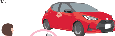
エンジンスターターで ドアロック

お車から降りて、全てのドアを開けて運転席ドア付近にて必ず エンジンスターターのリモコン でドアロック操作を行い施錠してください。