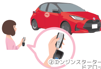
②エンジンスターターで ドアロック