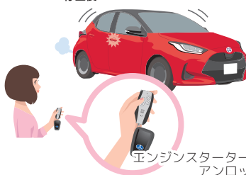
エンジンスターターで アンロック